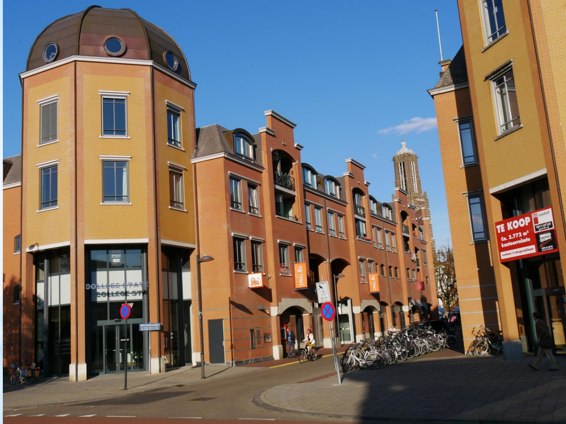
College State (2018)