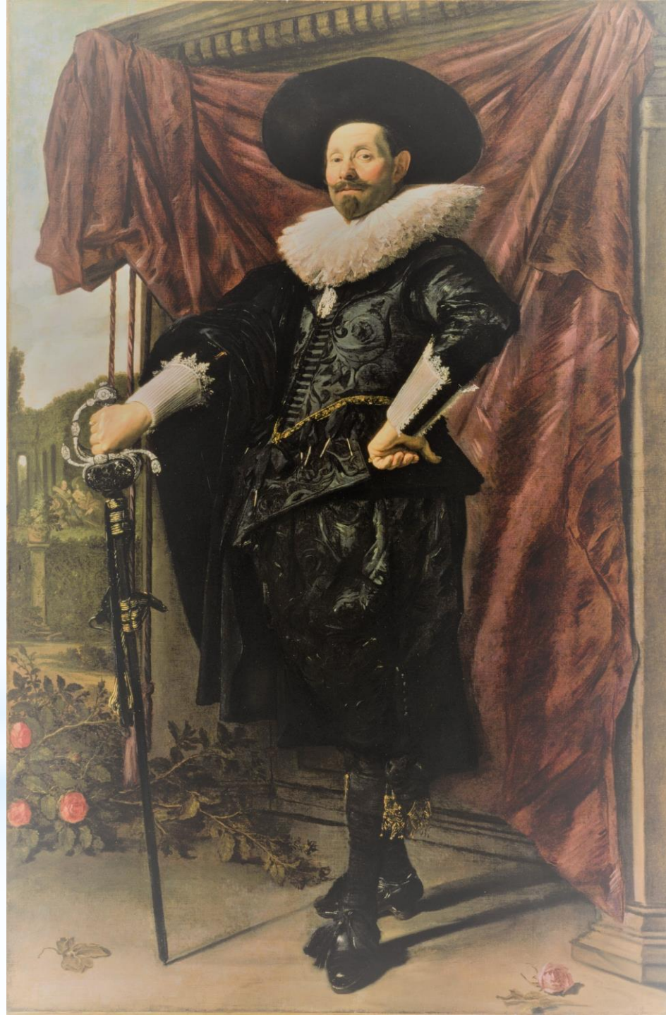
Sir Edgar Vincent

gekostumeerd bal jubileum Victoria (1897)