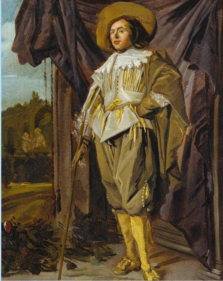
J. Leyster (c. 1630)