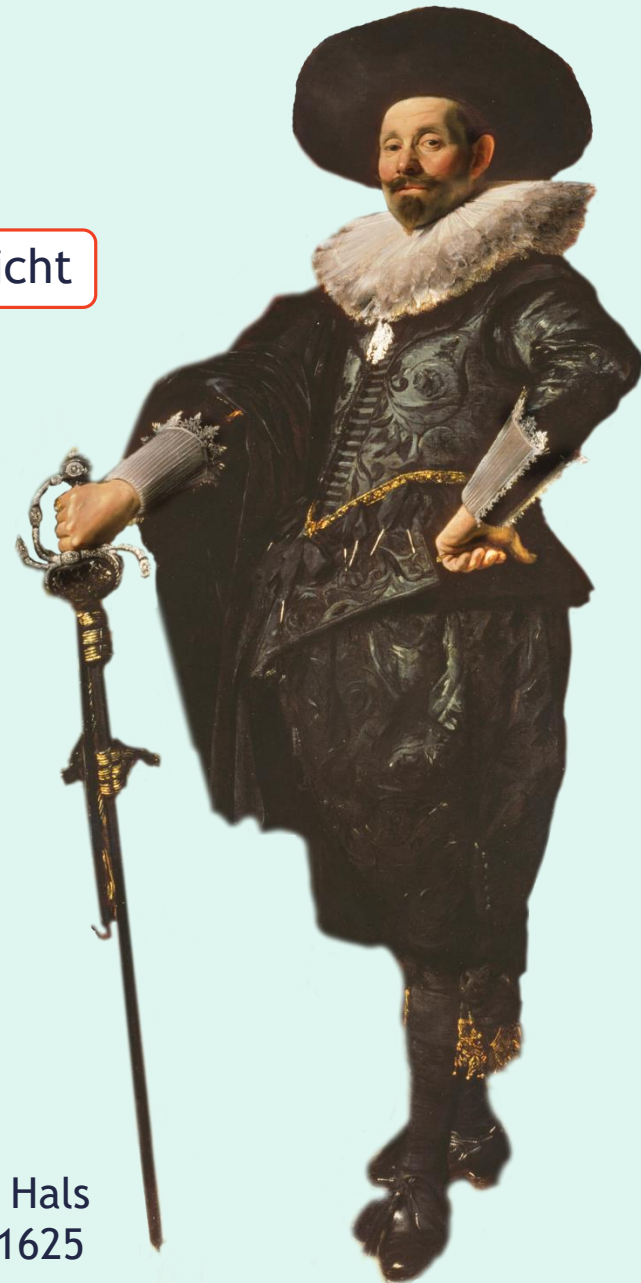
F. Hals ±1625