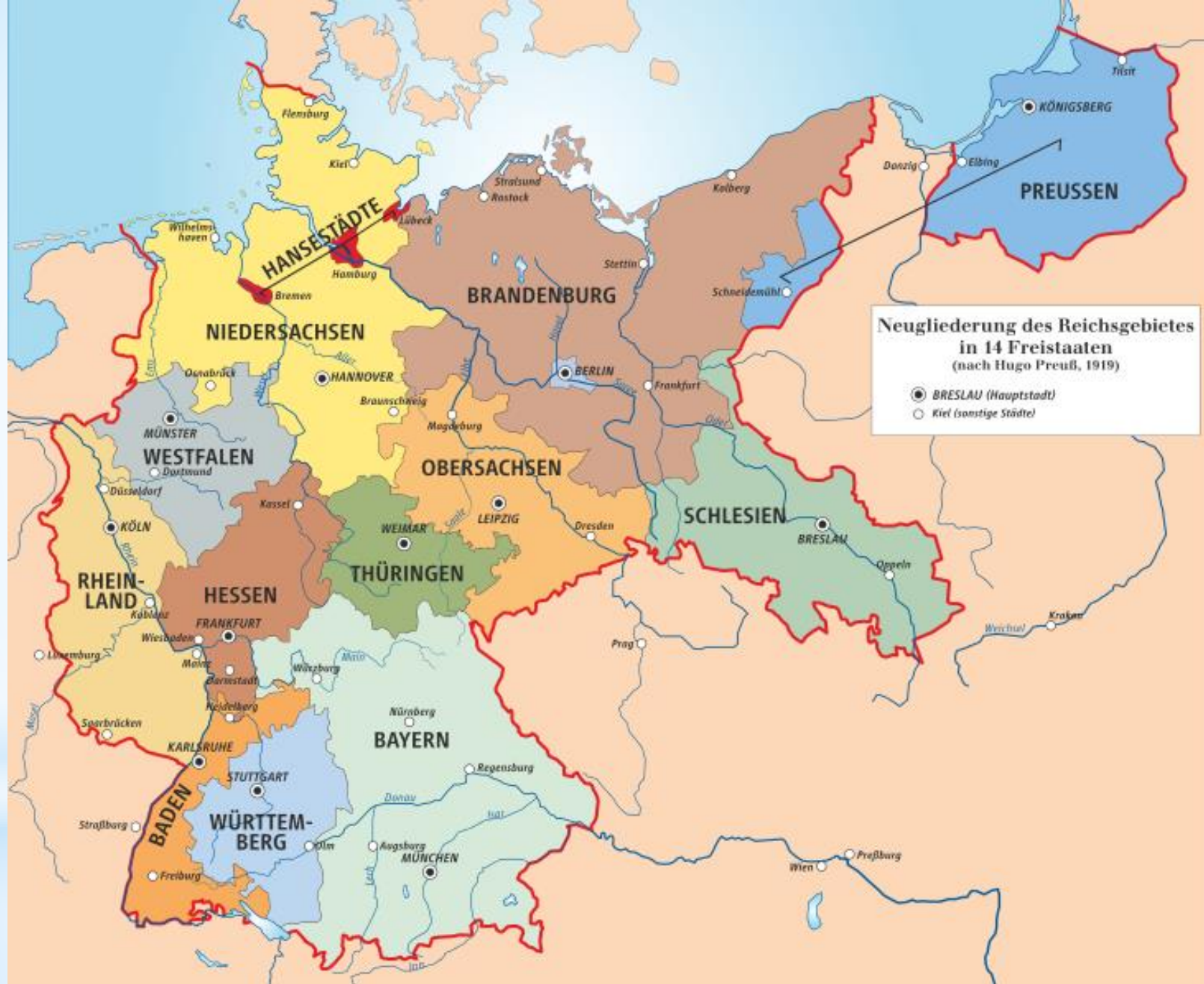
staatkundige situatie c.1918