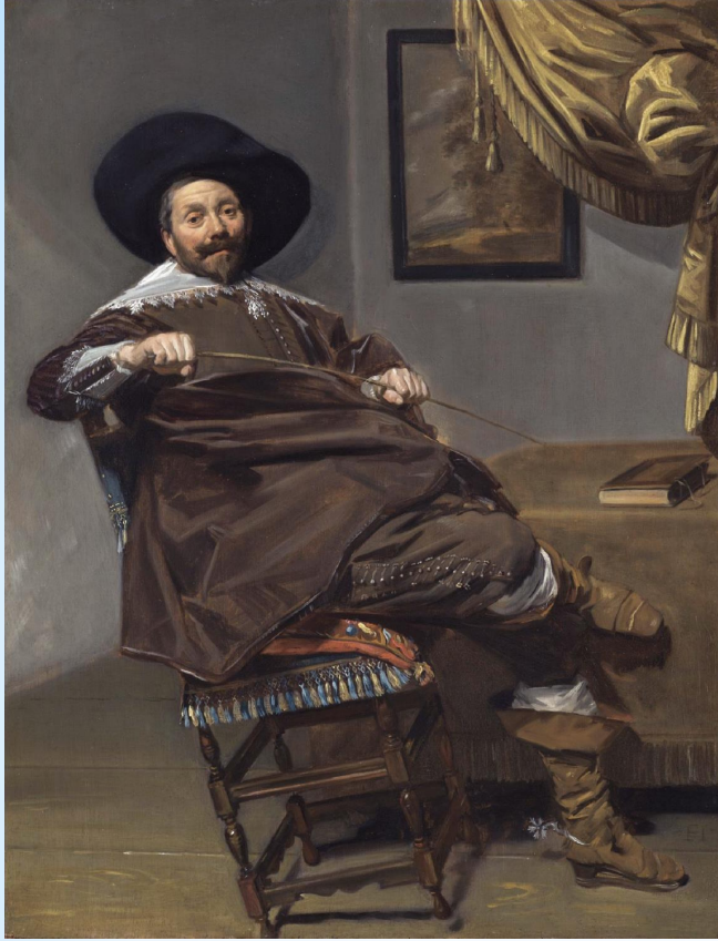
Willem van Heythuysen 60+ (geb c.1585)