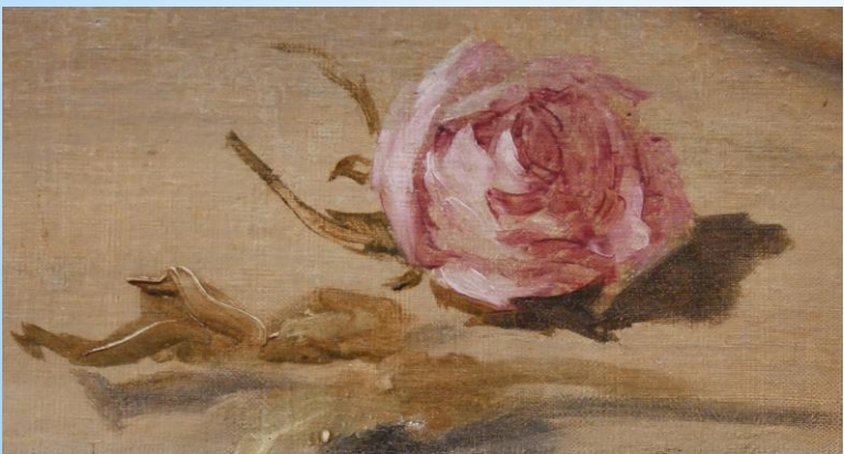
F. Hals (c.1625)