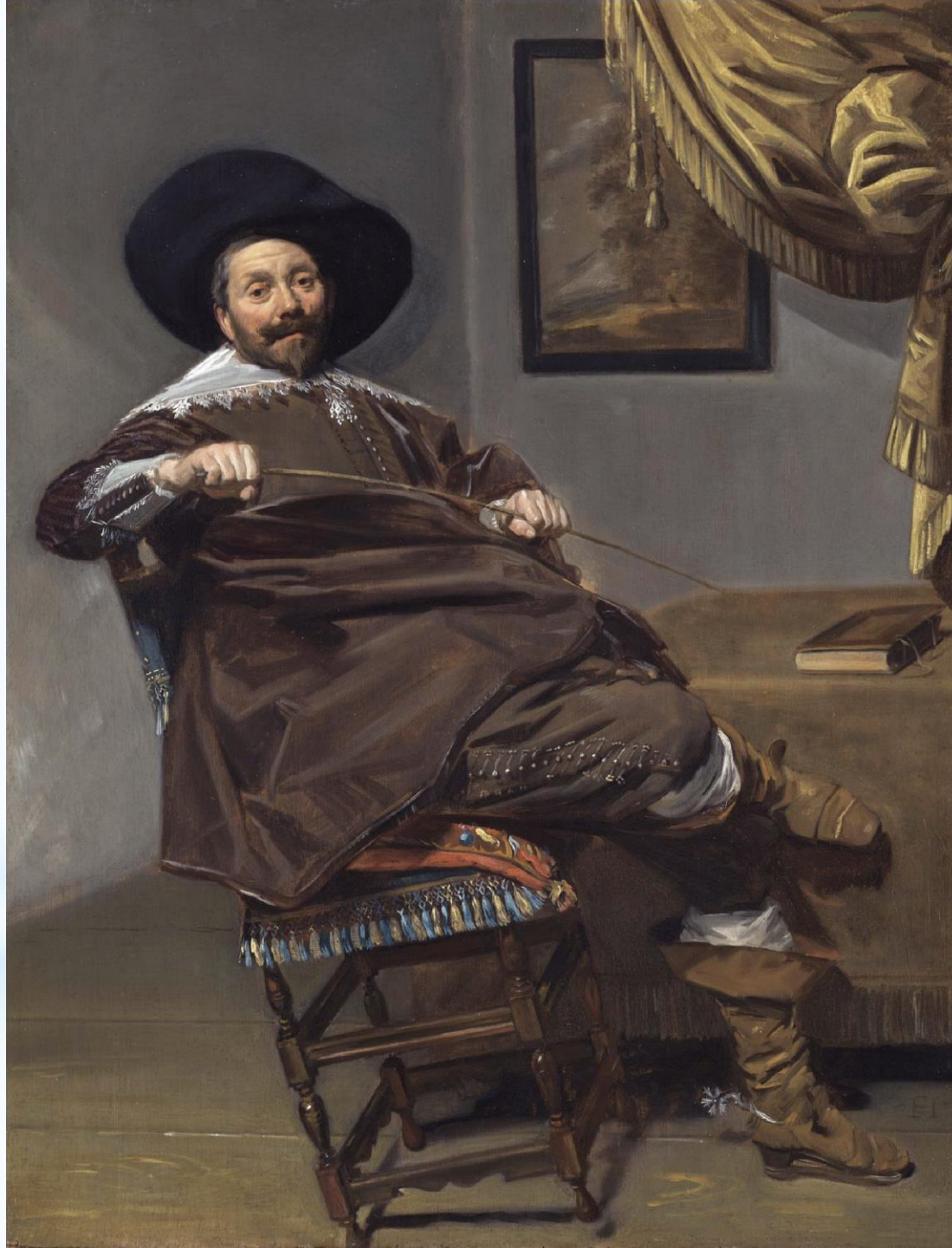
Willem van Heythuysen